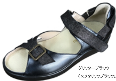
グリッターブラック (×メタリックブラックレザー)