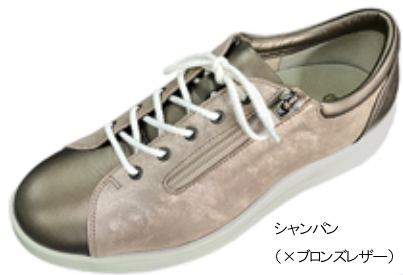
シャンパン (×フロンズレザー)