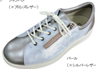
パール (×シルバーレザー)