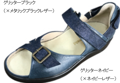
グリッターネイビー (×ネイビーレザー)